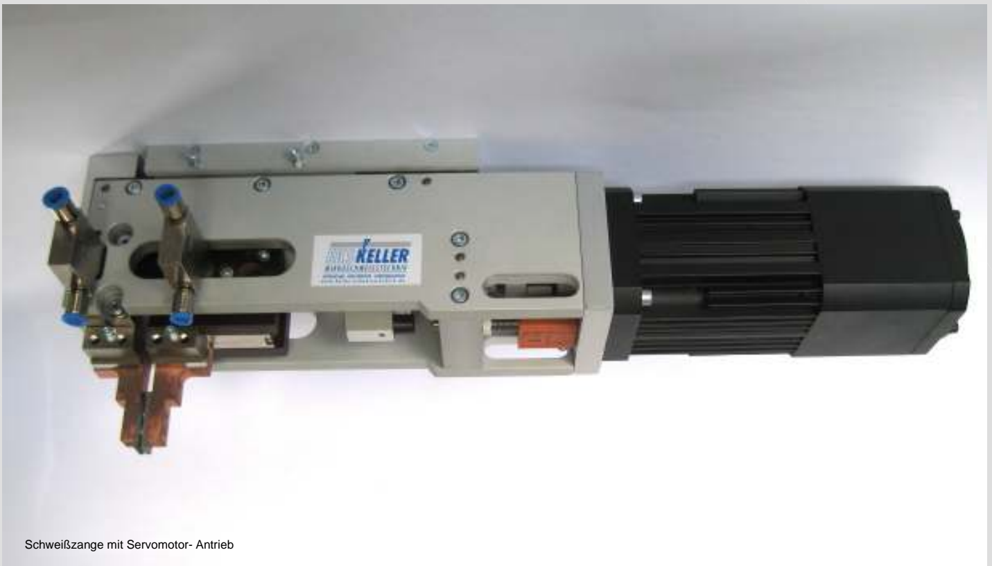
Schweißzange mit Servomotor- Antrieb

Schweißkraft: 1-40 daN (Servomotor- Antrieb) Baureihe: ZSK006